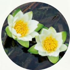
日本青森縣的午未交接之時，子午蓮( Nymphaea pygmaea )靜靜地盛開在平原沼澤；未時終了，朵朵白蓮逐漸閉合。這優雅美麗的身影曾被記錄在臺灣的桃園及日月潭，如今已在臺灣野外消失。