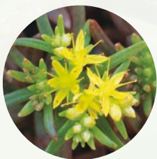
馬祖佛甲草( Sedum matsunense )為2023年根據分子親緣分析結果佐證發表的新種，僅見於馬祖北竿與東莒的潮溼岩壁上。葉序互生，原生地的花與葉近簇生。

發行 人：楊嘉棟 總 編 輯：林旭宏 編 審：自然保育季刊編審委員會 林旭宏(召集人)、鄭錫奇、張仕偉、林彥博、林子超、張和明、林瑞興、李先祐、許再文、張麗慧、薛美莉、江郁宣 英 審：劉奇璋 主 編：薛美莉 編 輯：蔡雅芬、鄭瑞瑤 美 編：天晴文化事業 出 版：農業部生物多樣性研究所 552005南投縣集集鎮民生東路1號 049-2761331 網 址： https://www.tbri.gov.tw/ 印 刷：天晴文化事業 06-2933266 定 價：新臺幣150元整 郵政劃撥帳號：22144080 戶 名：有限責任生物多樣性研究所員工消費合作社 電 話：049-2761331轉170 展 售 處： 五南文化廣場 臺中市西區臺灣大道二段85號 04-22260330 國家書店(松江門市) 臺北市松江路209號1F 02-25180207