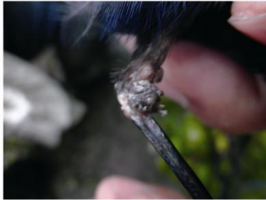
White-tailed Robin, A47059, July 7, 2011