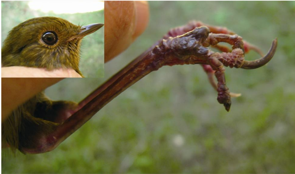
圖 2. 非發作中類禽痘症的案例 – 超過 1 齡白尾鶇( Cinclidium leucurum )雌鳥，2010 年 12 月 12 日於新北市新店區四崁水紀錄。

Fig. 2. A case of inactive avian pox-like lesions recorded from an after-hatching-year female white-tailed robin ( Cinclidium leucurum ) in Sikanshui, Xindian, New Taipei on December 12, 2012.