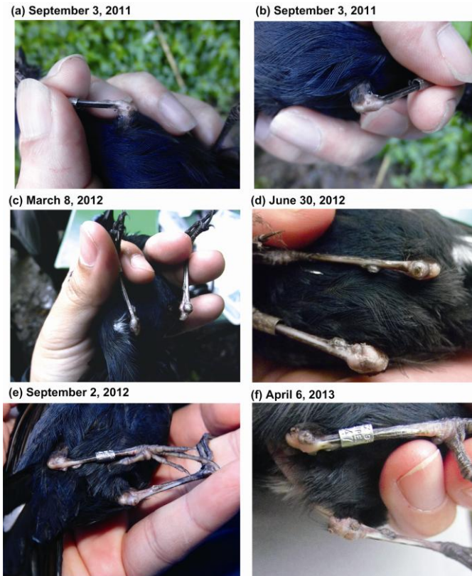
圖 4. 1 隻出現類禽痘症的白尾鷓( Cinclidium leucurum )(環號: A47057)雄鳥及其病變由 2011 年至 2013 年的變化。