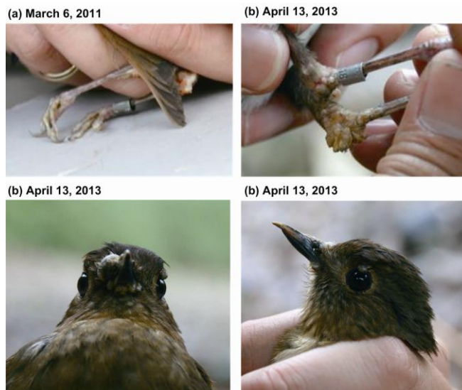
圖 3. 1 隻出現類禽痘症的白尾鶇( Cinclidium leucurum ) (環號：B45118)雌鳥及其病變由 2011 年至 2013 年的變化。

Fig. 2. A case of inactive avian pox-like lesions recorded from an after-hatching-year female white-tailed robin ( Cinclidium leucurum ) in Sikanshui, Xindian, New Taipei on December 12, 2012.