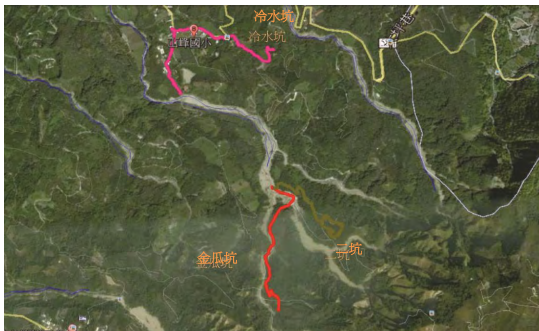
圖 1. 山峰社區蝴蝶調查穿越線示意圖。

由於當地的棲地環境多屬農業生態系，有菜圃、龍眼園、檳榔園及柑橘園等；森林生態系中以竹林為主，也有少部分的次生林。2012年12月間探勘棲地後，選定二坑、冷水坑及金瓜坑等3條穿越線進行調查(圖1)。冷水坑穿越線主要調查範圍為149號縣道及部分產業道路，區域範圍包含了社區聚落、山峰國小、咖啡園、竹林及部分人工造林地；二坑穿越線為竹林及次生林；金瓜坑穿越線主要沿著溪岸旁產業道路、次生林、竹林及周邊區域。此3條穿越線除了當地農民的農事工作外，較少有人為之干擾。各穿越線之海拔高度、座標及植被描述，詳如表1。