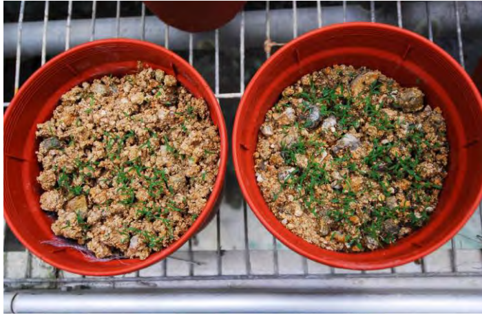
圖 5. 南橫(左)與大油坑(右)種源白背芒在大油坑土壤發芽率比較。

Fig. 5. Germination rate of Nanhen (left) and Dayukeng (right) strain of Miscanthus sinensis var. glaber in the soil collected from Dayukeng.