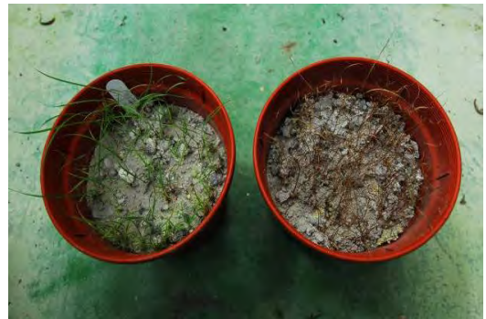
圖 2. 白背芒種子於大油坑距噴氣口不同距離之土壤 2 個月後生長狀態比較。左為距離 50 m 土壤，右為距離 20 m 土壤。

Fig. 1. Growth comparison of Miscanthus sinensis var. glaber in soil collected at 20 m (right) and 50 m (left) from Dayukeng fumarole after one month.