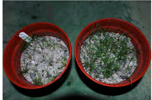
圖 1. 白背芒種子於大油坑距噴氣口不同距離之土壤 1 個月後生長狀態比較。左為距離 50 m 土壤，右為距離 20 m 土壤。

經消毒之白背芒種子，播種於距噴氣口 20 m、50 m 及 100 m 之未滅菌土壤，種子約 1 周後發芽，白背芒播種於距噴氣 20 m 土的初期生長比播種於距離 50 m 土要好（圖 1），然而 1 個月後，植株陸續死亡，2 個月後播種於距離噴氣口 20 m 土的白背芒全數死亡（圖 2），將盆鉢土壤進行孢子分離，並無發現任何菌根菌孢子，播種於距離噴氣口 50 m 土的白背芒，6 個月後進行土壤孢子分離，分離出 G. minutum 及 Paraglomus occultum ，播種於距離噴氣 100 m 土的白背芒，6 個月後進行土壤孢子分離，分離出 P. occultum 、 E. columbiana 及 Scutellospora calospora 。