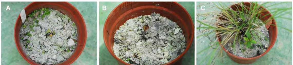
圖 6. 大頭茶於距離大油坑噴氣口 20m 土壤進行不同菌根菌接種處理 7 個月後之生長比較(a: 接種 E. columbiana 孢子 150 顆；b: 對照組不接菌；c: 以感染 E. columbiana 之白背芒作為接種源)。

大頭茶幼苗以距離大油坑噴氣口 20 m 及 120 m 之滅菌土壤分別進行菌根菌接種處理，3 種處理於 4 個月後進行染根，染根結果發現移植於距離大油坑噴氣口 120 m 土壤之大頭茶，以孢子接種或是以菌根白背芒作為接種源，均可形成菌根，10 個月後在植株高度及植株乾重上也明顯優於未接菌之對照組(表 3)。而移植於距離大油坑噴氣口 20 m 土壤之大頭茶以孢子為接種源之處理並未形成菌根，而以菌根白背芒作為接種源之處理已形成菌根，6 個月後未形成菌根之未接種菌根對照組與以孢子為接種源之 2 種處理之大頭茶，植株陸續產生葉片紅化與葉緣及尖端變黃焦枯等營養缺乏的特徵，並於 7 個月後陸續枯萎死亡(圖 6a、6b)。反觀以菌根白背芒作為接種源處理之大頭茶則生長良好(圖 6c)。