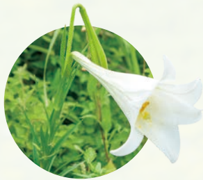
麝香百合( L. longiflorum var. longiflorum ) 常見於蘭嶼及綠島向陽的濱海及山坡地上。

發行人：楊嘉棟 總編輯：林旭宏 審：自然保育季刊編審委員會 林旭宏(召集人)、鄭錫奇、張仕偉、林彥博、林子超、 許再文、林瑞興、楊正雄、何東輯、沈秀雀、薛美莉、黃秀玉 英審：劉奇璋 主編：薛美莉 編：蔡雅芬、鄭瑞瑤 美編：天晴文化事業 出版：行政院農業委員會特有生物研究保育中心 552005南投縣集集鎮民生東路1號 049-2761331 網址： https://www.tesri.gov.tw/ 印刷：天晴文化事業 06-2933266 定價：新臺幣150元整 郵政劃撥帳號：22144080 戶名：有限責任特有生物研究保育中心員工消費合作社 電話：049-2761331轉170 展售處： 五南文化廣場 臺中市西區臺灣大道二段85號 04-22260330 國家書店(松江門市) 臺北市松江路209號1F 02-25180207