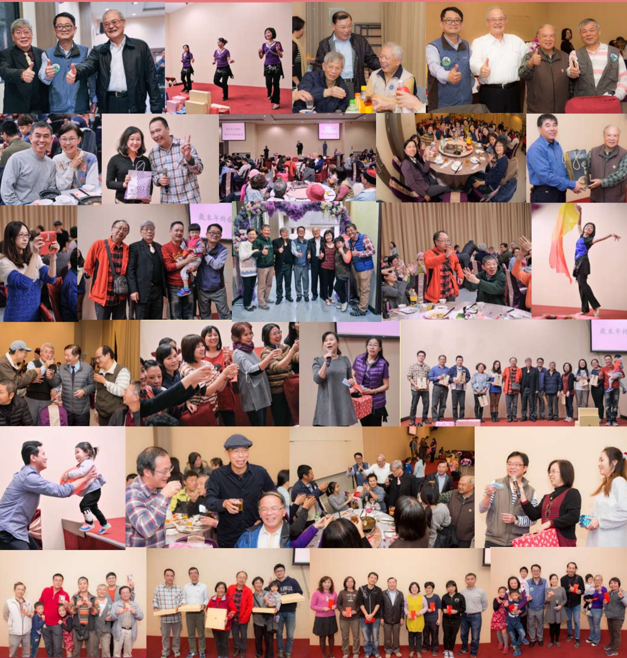
圖 / 施禮正、許良州