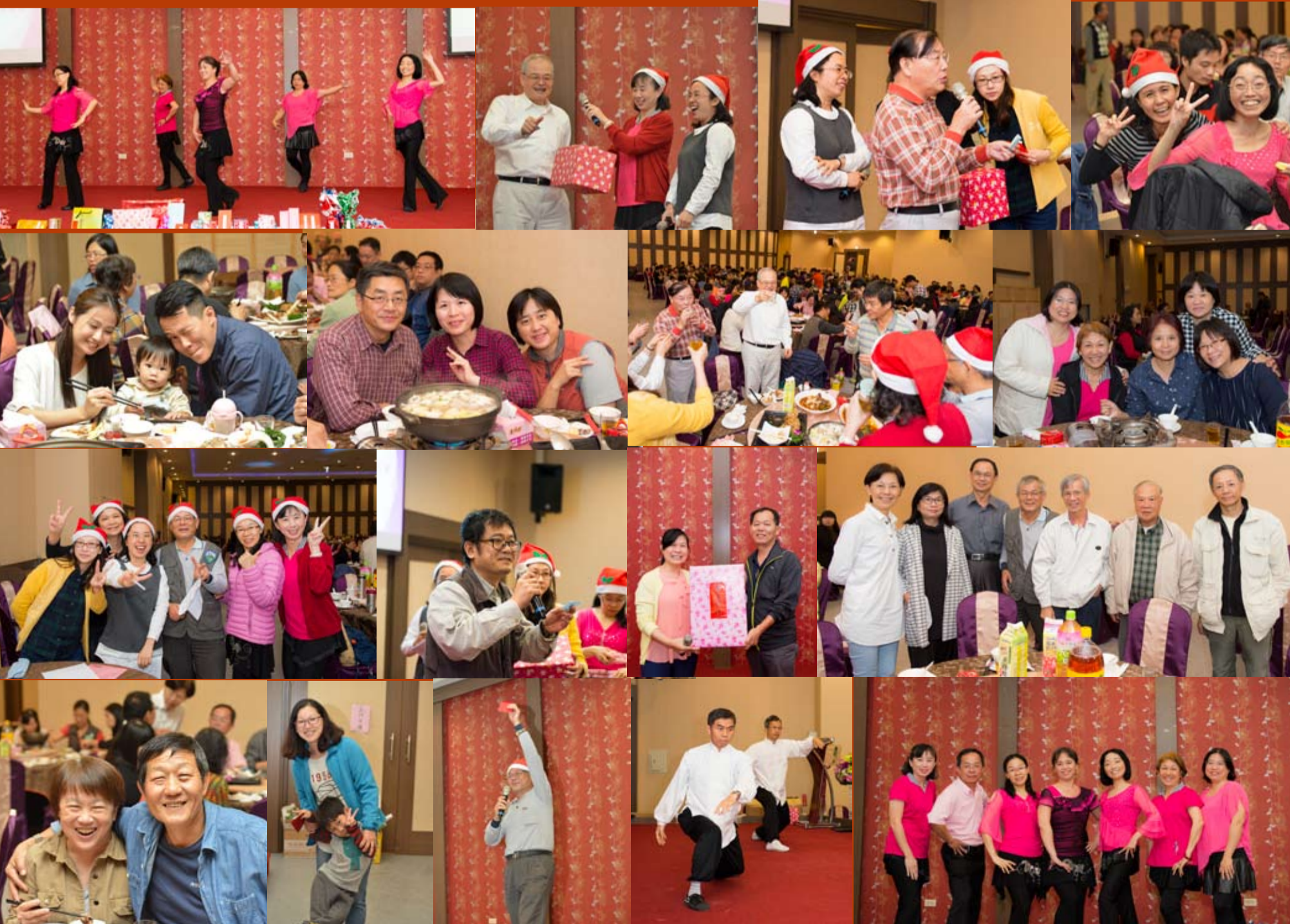
圖 / 施禮正、廖國勝